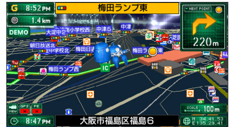
MAPPLUSポータブルナビ3 案内中画面