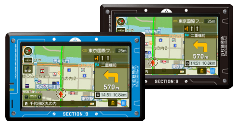
MAPPLUS PND 限定モデル

※©士郎正宗・Production I.G/講談社・攻殻機動隊製作委員会 ※PSP®「プレイステーション・ポータブル」は株式会社ソニー・コンピュータエンタテインメントの商品です。